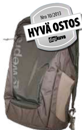
Photo Hatchback on sekä hyvä reppu ja hinnaltaankin halpa. Se on melko kookas mutta siitä huolimatta kevyt, ja lisäksi kuvauskalusto on sen sisällä hyvässä suojassa. Sen sijaan taulutietokonetta tai kannettavaa tietokonetta suojaava pehmuste on ohut. Reppuun mahtuu kamerarunko ja kolme pientä objektiiviä. Teleobjektiivi on irrotettava kamerasta kuljetuksen ajaksi, mikä on usein epäkäytännöllistä. Kalustoon pääsee käsiksi vain selkäpuolelta. Se on vähän hankalaa, sillä olkahihnat ja lantiovyö ovat helposti tiellä.

YHTEEENVETO: Järkevä valinta pienen järjestelmäkameran tai peilittömän järjestelmäkameran käyttäjälle. Kameraosa on niin pieni, että kamerassa kiinni oleva telezoom ei sinne mahdu. Tietokonelekerossa on ohuet pehmusteet.