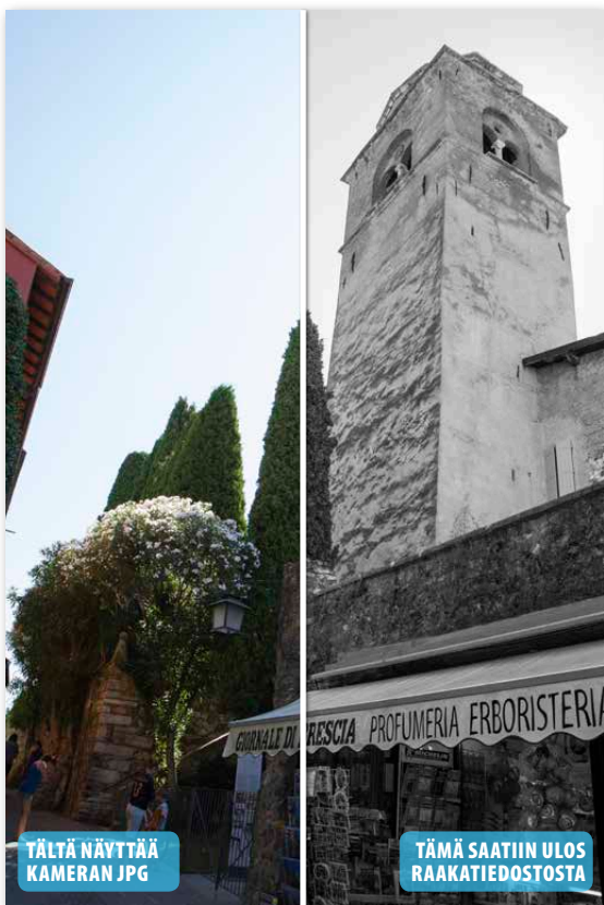
Kahdeksan värisävyn kirkkautta säädettiin niin, että kuvan kaikki tärkeät alueet ovat mustavalkokuvassa sävykkäitä.

Valo- ja varjokohtien sävyt säilyvät raakatiedoissa paljon paremmin kuin jpg-tiedoissa. Tämä etu on ratkaiseva silloinkin, kun kuvasta tehdään mustavalkoinen. Photoshopin ja Lightroomin raakamuuntimissa on nimittäin tehokkaita toimintoja värikuvien mustavalkomuunnokseen. Niissä voidaan säätää kahdeksan eri värisävyn kirkkautta ja sekoittaa niiden suhteita, joten sinistä tai vasta voidaan tummentaa ja punaista seinää vaalentaa. ■