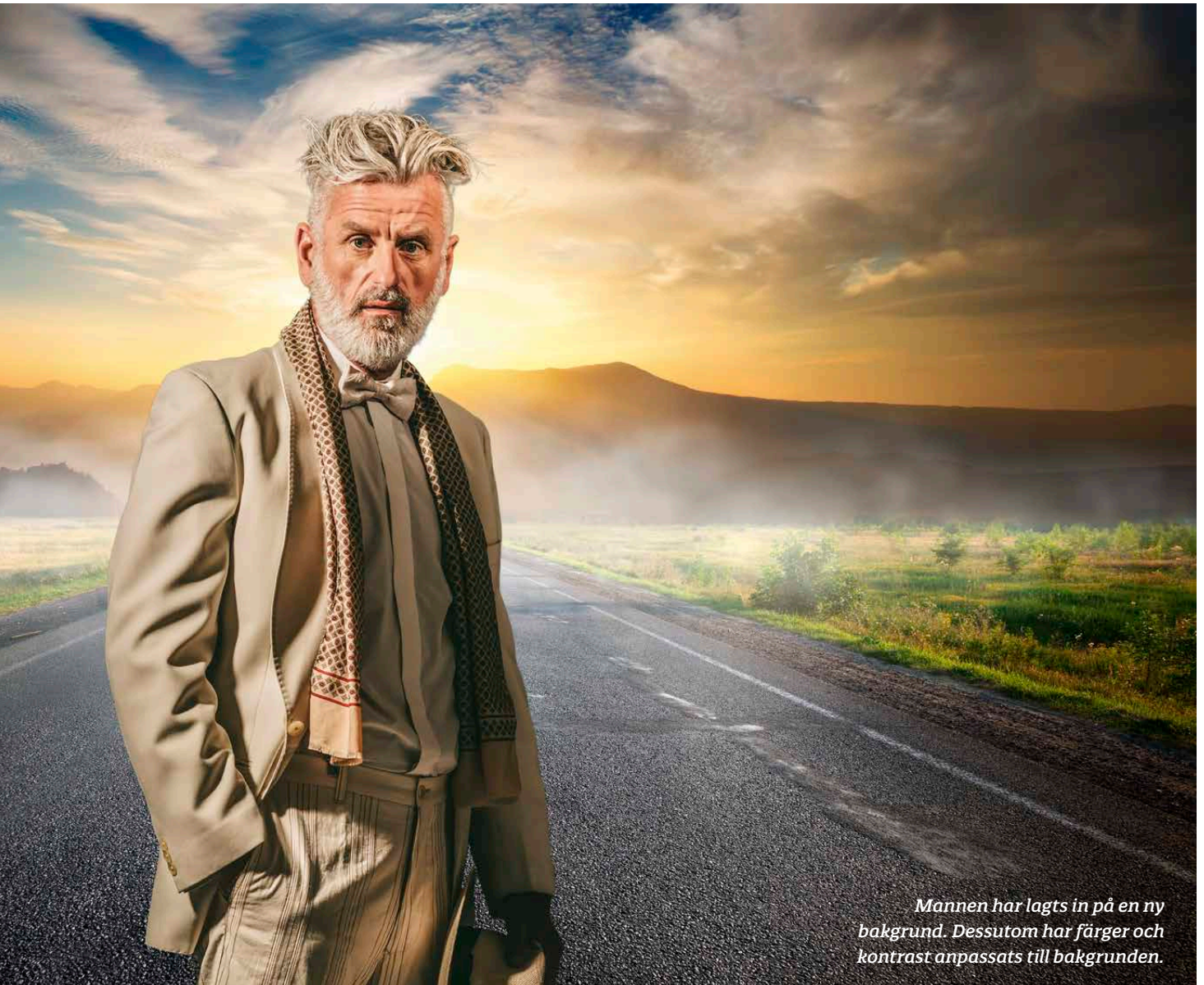
Mannen har lagts in på en ny bakgrund. Dessutom har färger och kontrast anpassats till bakgrunden.