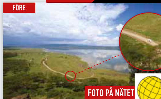
FOTO PÅ NÄTET