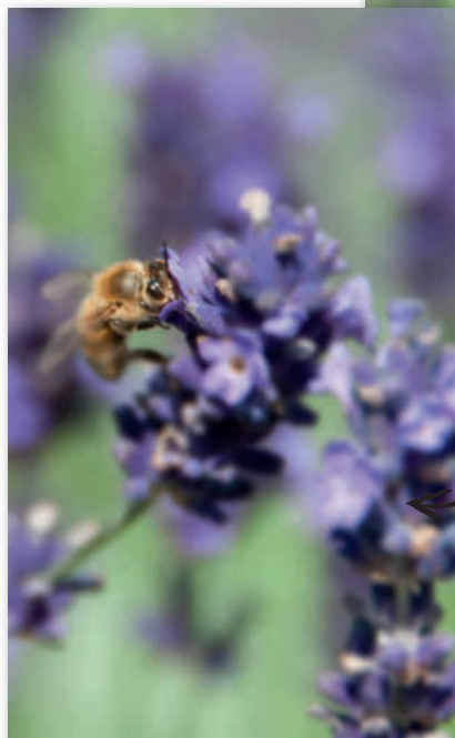
Skärpedjupet har nu begränsats till biets huvud och en del av blomman.

Behöver man ett begränsat skärpedjup finns det dock en billigare lösning som du kan använda i kombination med billigare objektiv som har en största bländare på t.ex. F3.5. Elements har nämligen den fiffiga funktionen Skärpedjup, som du i bildbehandlingen kan använda för att väldigt exakt begränsa skärpedjupet i en bild. Kursbilden är t.ex. tagen med ett paketobjektiv vid bländare F5.6, vilket räcker för att göra hela biet skarpt. Men om man vill att bara huvudet ska vara skarpt kan man alltså fixa det med den här funktionen. Det är dessutom en god idé att applicera mer skärpa på bilden, så att huvudmotivet blir extra skarpt innan vi slutligen lägger på en styrd oskärpa. ■