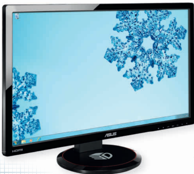
Ergonomin är bra och skärmen kan justeras i höjdlid, vridas och vinklas.

Allt detta har dock sitt pris. Skärmen baseras på en TN-panel i stället för en dyrare och bättre IPS-dito som brukar sitta i stora skärmar i den här prisklassen. Upplösningen på 1920x1080 pixel är inte heller imponerande.