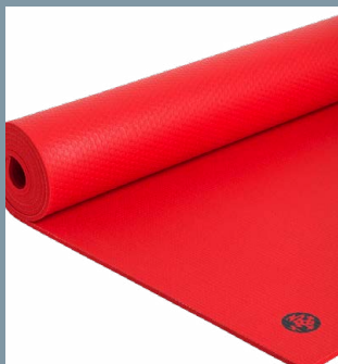
En måtte for livet

En god yogamåtte er et must, hvis man skal stå stabilt i de ofte krævende stillinger. En yogamåtte er dog god at have, selv hvis du ikke dyrker yoga. Måtterne kan nemlig sagtens bruges til andre ting – fx styrkeøvelser, pilates eller udstrækning efter løbeturen. Alle måtterne i denne test er blevet afprøvet grundigt i mange forskellige stillinger, lige fra hundestrækket til solhilsenen og krigeren. Måtterne er blevet bedømt på mål, vægt, skridsikkerhed og komfort samt praktisk anvendelighed.